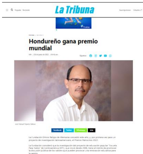
Abb.2: „Ein Honduraner gewinnt einen Weltpreis“ (Tageszeitung La Tribuna , vom 28.6.2022)

https://www.latribuna.hn/2022/06/28/hondureno-gana-premio-mundial/