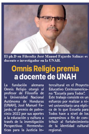
Abb 1: „Omnis Religio zeichnet einen Dozenten der UNAH aus“ (Amtsblatt der Universität Honduras vom 1.7.2022)