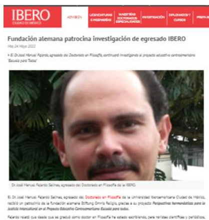
Abb. 3: „Eine deutsche Stiftung fördert die Forschungsarbeit eines IBERO-Absolventen“ (offizielles Publikationsorgan der Iberoamerikanischen Universität, Mexiko)

https://www.latribuna.hn/2022/06/28/hondureno-gana-premio-mundial/